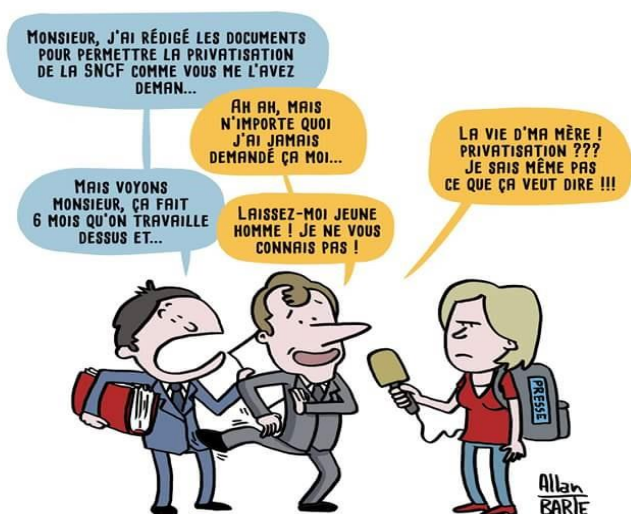
SNCF: RÉVÉLATION D'UNE NOTE INTERNE PRÉPARANT LE TERRAIN DE LA PRIVATISATION

Le 29 Mai, c'est le début de l'examen du projet de loi au Sénat. Pendant que les sénateurs discuteront de la date de la fin du statut, des milliers de cheminot-e-s seront en grève !