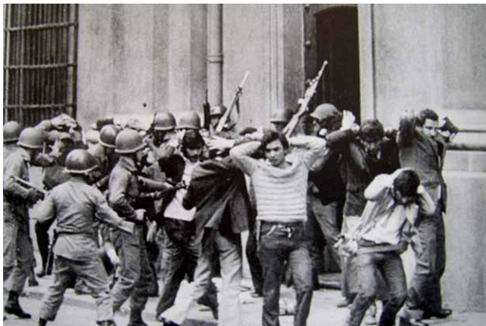
11 septembre 73, Chili