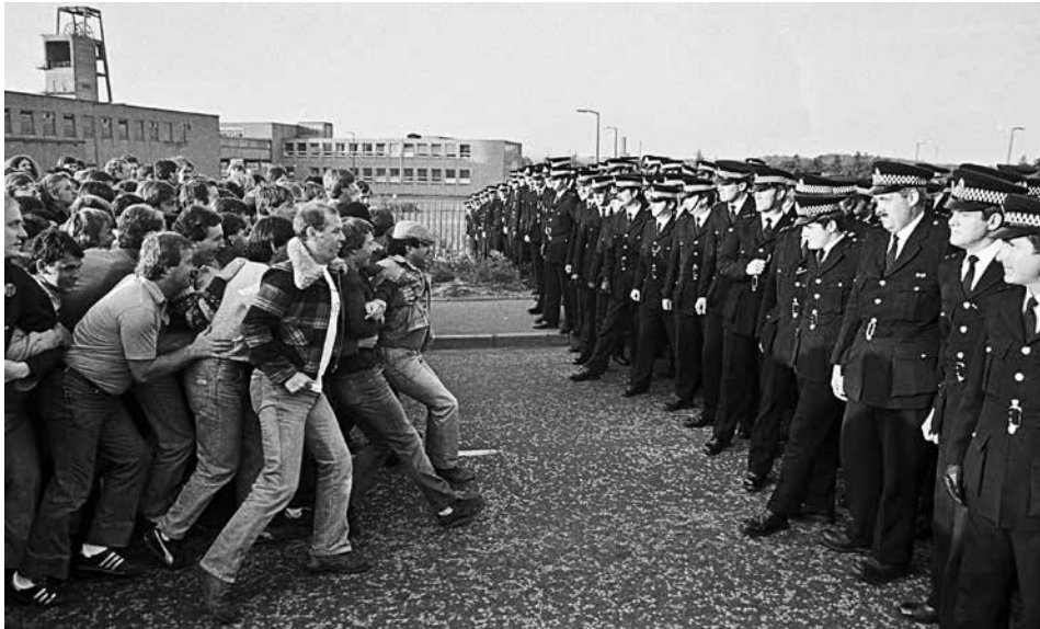
Grève des mineurs, Grande Bretagne, 1984

plexe et de plus en plus contrainte. C'est aussi briser les contre-pouvoirs dans les entreprises ce qu'a très bien fait la loi travail en supprimant les CHSCT dans un contexte de déploiement des pratiques managériales de contrôle des salariés.