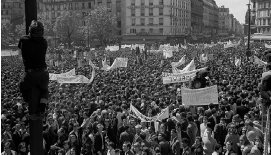
Mai 68 en France

durant toute cette période contre les classes populaires de par le monde.