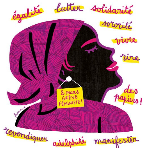
Union syndicale Solidaires - 31 rue de la Grange aux belles 75010 Paris - solidaires.org

Un préavis national SUD Rail couvrant l'ensemble des cheminot-e-s pour la journée du 8 mars. N'hésitez pas à vous rapprocher de vos militant-e-s SUD Rail pour connaître les différentes manifestations proches de chez vous.