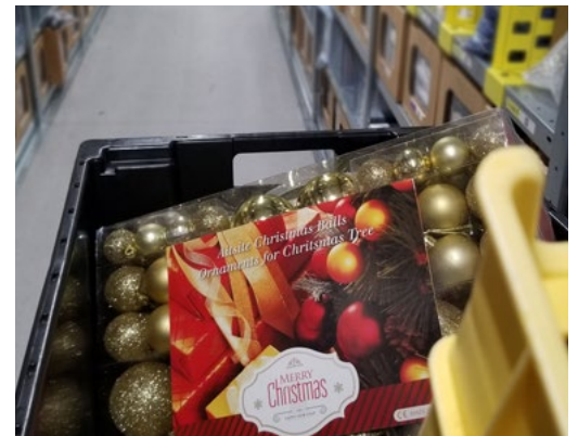
Abbildung 4: Weihnachtsschmuck