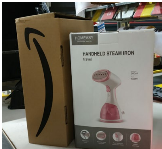
Abbildung 5: Reisebügeleisen