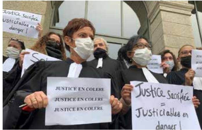
Justice en lutte