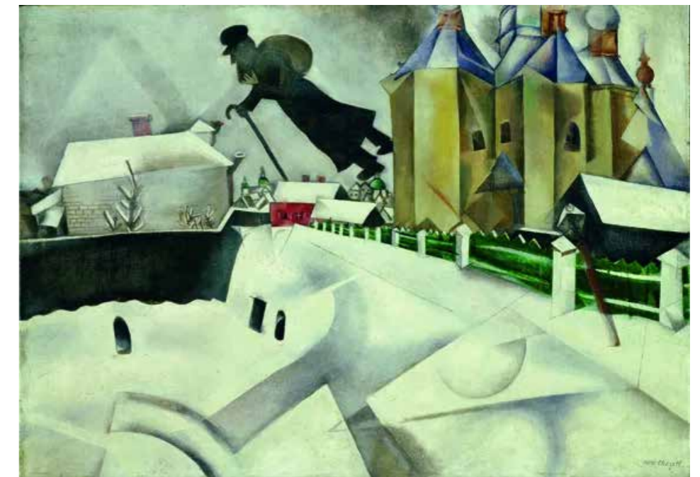
Au dessus de Vitebsk