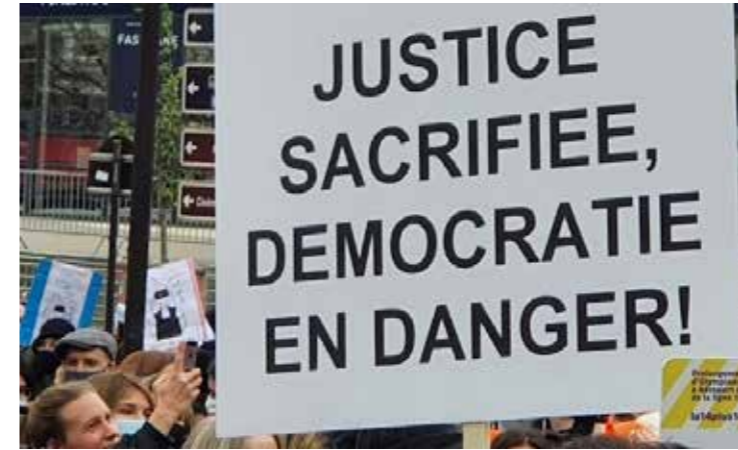
Justice en lutte