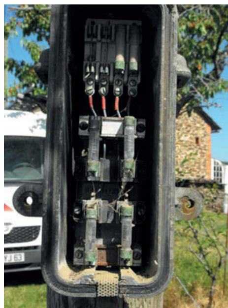
(Parasurtenseur radioactifs, lignes téléphoniques - CRIIRAD)

Ces deux cas montrent, qu'en l'absence d'un cadre réglementaire législatif contraignant, les dispositifs de dépose des matériels radioactifs ne sont pas respectés, en particulier le recours systématique aux sociétés spécialisées et agréées par l'ASN